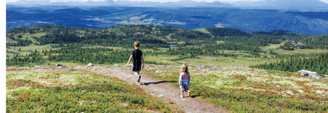
Forsidebildet: En nydelig kveld ved toppen av HallingSpranget (tur nr 67). Denne siden: To unge turgåere på Kvasshovda, en barnevænnlig tur på Nesfjellet (tur nr 25).

Plan your hike with Ut.no Ut.no is a free trip planner from the Norwegian Trekking Association (DNT), offering detailed maps, route descriptions, photos, and elevation profiles. All the hikes featured in this brochure are available at www.ut.no or in the Ut.no app. To find a hike, open the map and navigate to the area you want to explore. You can also search for specific hikes or places, and view your current location on the map.